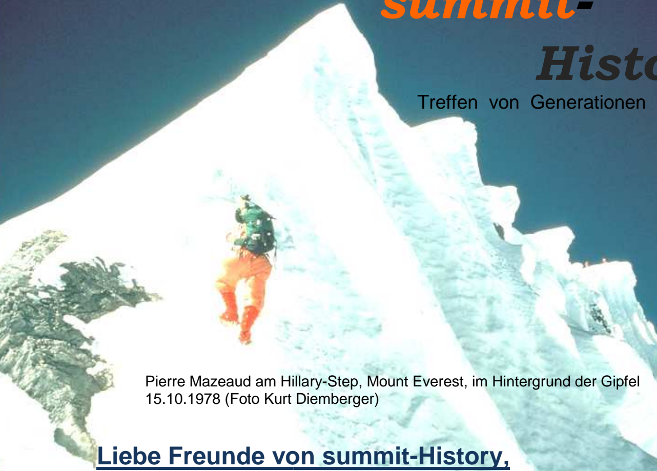
Pierre Mazeaud am Hillary-Step, Mount Everest, im Hintergrund der Gipfel 15.10.1978