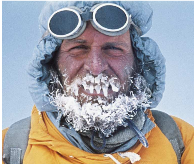
Kurt Diemberger auf dem Shartse, dem Everest-"Ostgipfel"

Er ist der einzige lebende Mensch, der zwei Achttausender erstbestiegen hat. Mit Hermann Buhl, Marcus Schmuck und Fritz Wintersteller bezwang Kurt Diemberger am 9. Juni 1957 den 8047m hohen Broad Peak ohne die Hilfe von Hochträgern oder Sauerstoffgeräten! Im „Westalpenstil“, wie es Buhl nannte, der kurz danach bei dem Versuch, zusammen mit Kurt Diemberger die Chogolisa zu besteigen, im Abstieg tödlich verunglückte. Am 13. Mai 1960 folgte die Erstbesteigung des Dhaulagiri (8167m) mit einer schweizerischen Mannschaft, ebenfalls ohne zusätzlichen Sauerstoff. Dieser Erfolg, 50 Jahre Erstbesteigung Dhaulagiri, wird Anfang Mai in Nepal gefeiert.